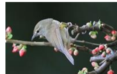
ウグイス (所沢市城)