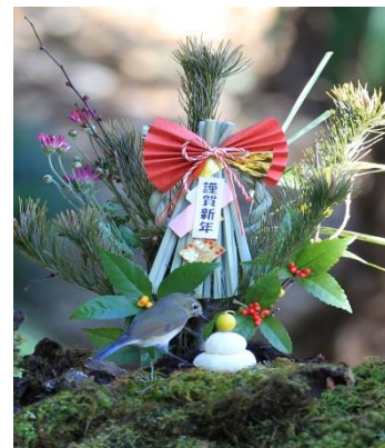
ルリビタキのメス (所沢市城)