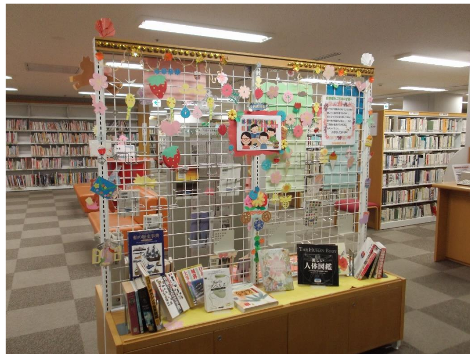
〈所沢分館特集展示架〉