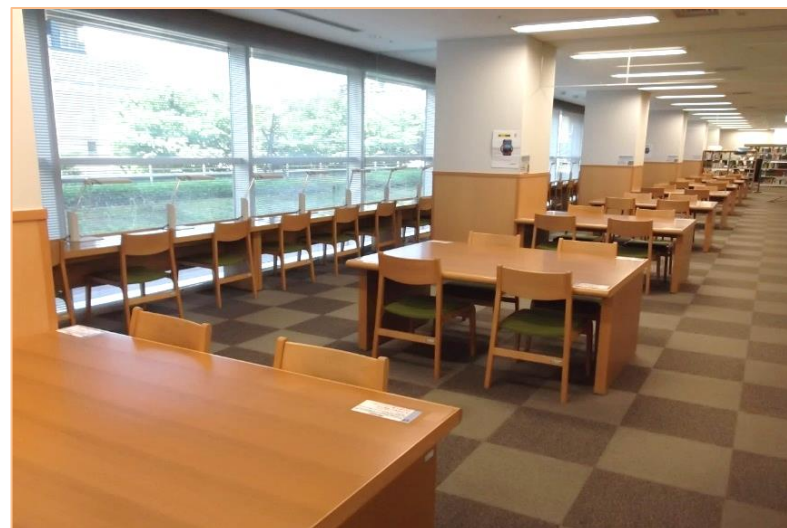
〈所沢分館 2階 閲覧席〉