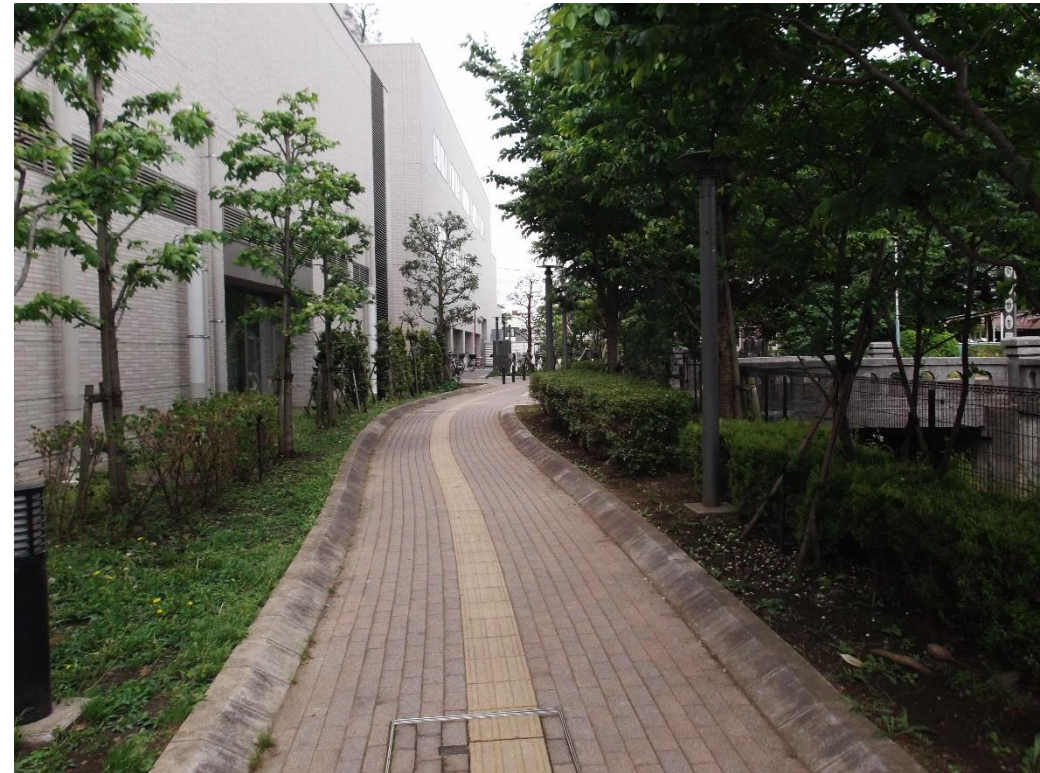
〈所沢分館北側プロムナード〉