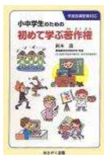
『小中学生のための初めて学ぶ著作権』 岡本薫 著 朝日学生新聞社 2011年《Y02》